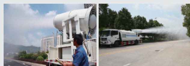
FLM5160TDYD4型、FLM5160TDYD5型、FLM5250TDYD4型系列多功能抑尘车

近期,来自北方的政府客户采购了一批城市环境清洁新产品——福龙马牌多功能抑尘车,独特的雾化作业模式吸引了众多眼球,当地省、市电视台等多家媒体争相报导,获得了社会民众的关注和赞许。龙马环卫新一代系列抑尘车创新发展出喷雾抑尘、局部降温功能,还具备节水灌溉、路面清洗保洁、应急电源输出等多种功能,是目前国内功能齐全、外观新颖、操作便捷的新概念产品,可广泛用于环保、环卫、应急响应等多种城市环境管理用途,是公司紧盯国家节能环保政策的一次大胆创新,可为治理空气环境控制城市扬尘发挥出不凡功效。