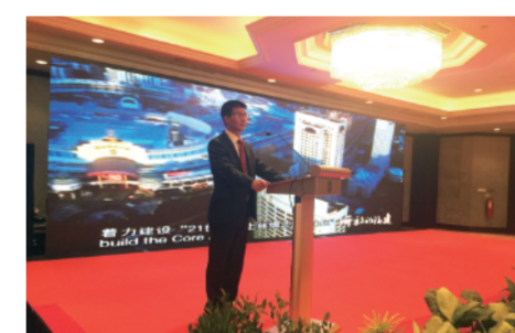
2015 年 9 月 9 日至 12 日,福建省政府代表团在印尼雅加达开展经贸推介活动,举办“福建—印

尼经贸推介会”,与当地政要、闽籍侨领和企业家会面交流,全面介绍福建在融入“一带一路”国家战略中的重要举措以及近年来福建经济社会发展情况和优越的投资环境,进一步推动双方经贸合作,促进互利共赢、共同发展。